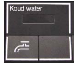
Fig 1. Voorbeeld van een uitgiftetoets